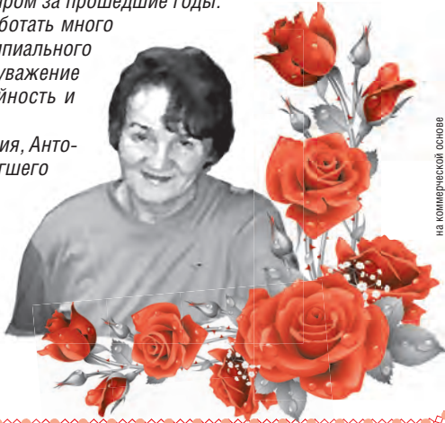
на коммерческой основе