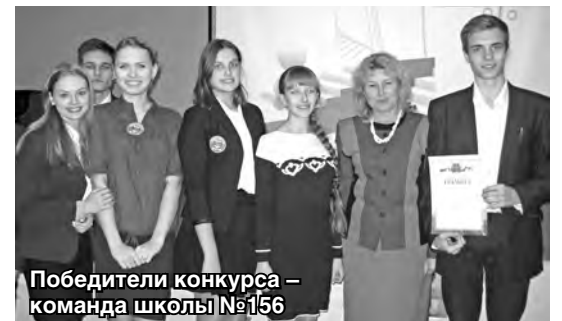
Победители конкурса – команда школы №156

Четвёртым заданием «Кого ищут рекрутеры?» стал разбор конкретных вакансий Центра заня-