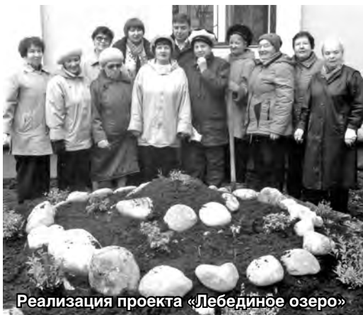
Реализация проекта «Лебединое озеро»

В зоне пристального внимания Совета находится вопрос по заключению договоров на вывоз ТБО и оплаты жителями частного сектора этой услуги. На сегодняшний день процент оплаты составляет около 90%.