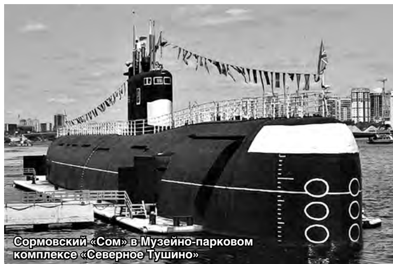
Сормовский «Сом» в Музейно-парковом комплексе «Северное Тушино»

В День Военно-морского флота России в Москве открылся мемориальный музей «Подводная лодка Б-396». С 1981 года лодка находилась в боевом составе 4-й Краснознаменной ордена Ушакова 1-й степени эскадры подводных лодок Северного флота. А построили её годом раньше на заводе «Красное Сормово».