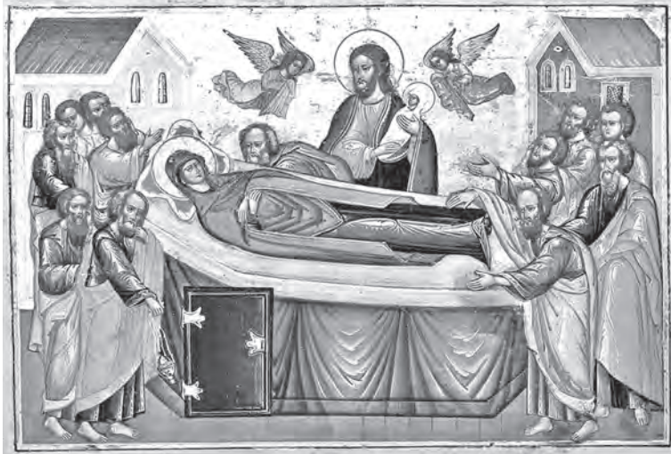
Успение Пресвятой Богородицы. Икона Киево-Печерской лавры, IX век

Апостол Фома прибыл, когда уже погребение завершилось. По