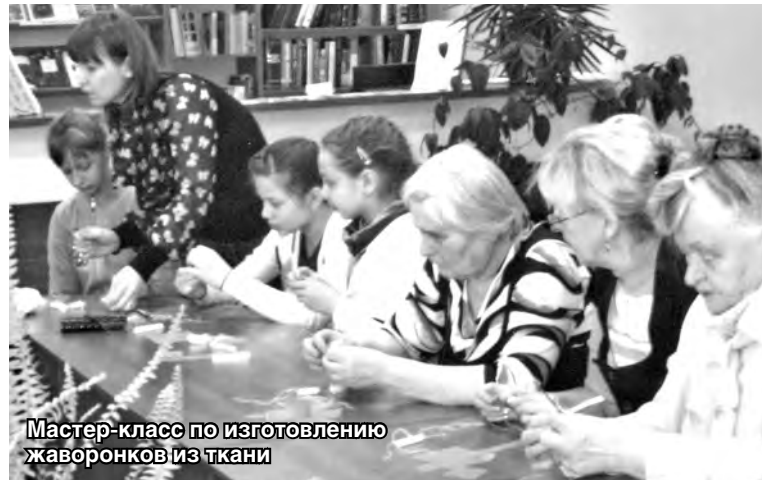
Мастер-класс по изготовлению жаворонков из ткани