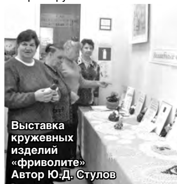
Выставка кружевных изделий «Фриволите» Автор Ю.Д. Стулов

народно-прикладного творчества и 10 мастер-классов: по изготовлению изделий из гипса, валяной шерсти, теста и многие другие. Активные жители микрорайона под руководством народных умельцев с радостью и удовольствием делают куклы-обереги, закладки для книг, учатся шить и кроить, завязывать косынки, знакомятся с историей русского костюма.