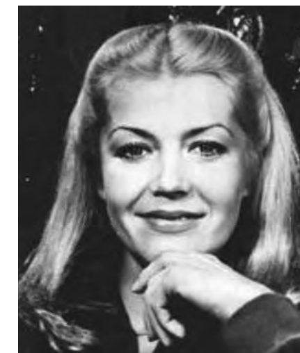
Актриса Лилита Озолиня в фильме «Долгая дорога в дюнах» носила имя Марта

И хотя до мая ещё далеко, почему бы не вспомнить имя Майя .