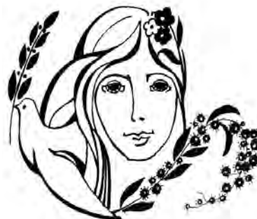
Рисунки Виктора Кротова

Я чувствую весенний запах нежный... Идёт Весна! В руке несёт подснежник!