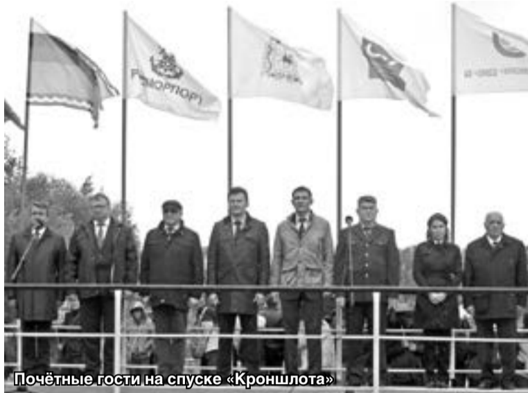
Почётные гости на спуске «Кроншлота»