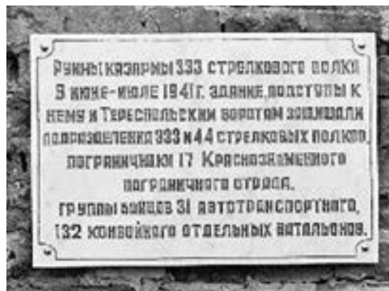
Мемориальная доска на руинах казарм 333-го стрелкового полка

Из всех бойцов 31-го автобата, находившегося в крепости, в живых осталось лишь несколько человек, в основном это те, кто попал в плен. Такая судьба выпала и