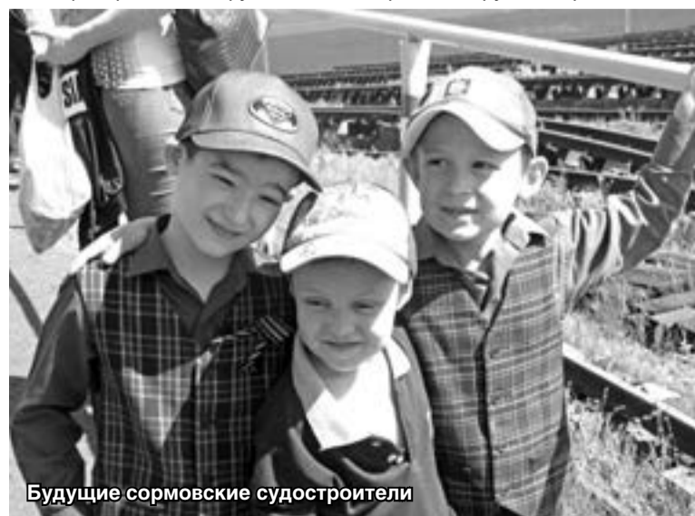
Будущие сормовские судостроители

Материалы подготовила Маргарита ФИНЮКОВА