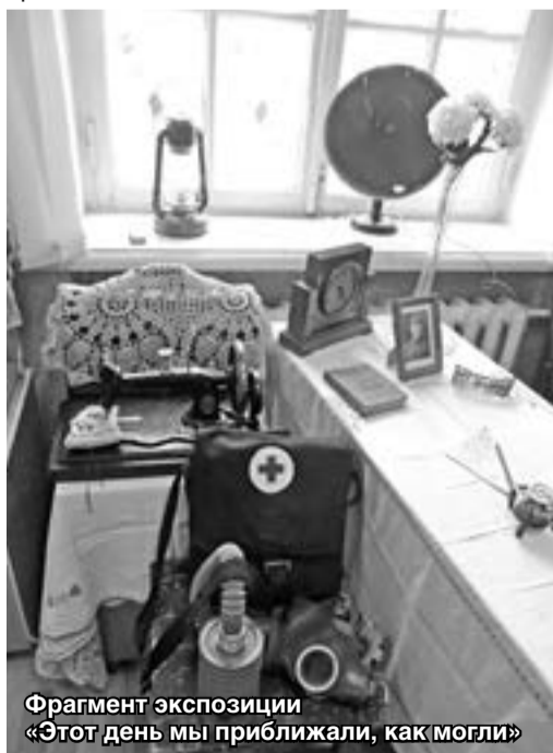
Фрагмент экспозиции «Этот день мы приближали, как могли»

Совместно с учреждениями культуры и общественными организациями подготовлены и проведены десятки массовых мероприятий.