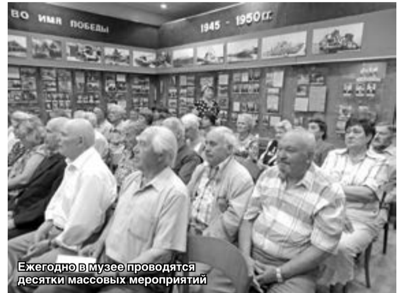
Ежегодно в музее проводятся десятки массовых мероприятий

да, обнаруженный на территории завода, кирпичи клеймённые XIX века, из которых были сложены заводские корпуса, макет УНРС (установки непрерывной разлива стали), действующий макет термической печи. Особо хочется сказать о двух новых экспонатах, которые были переданы музею