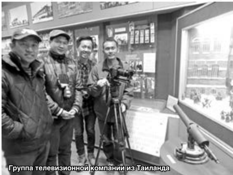
Группа телевизионной компании из Таиланда

где представлены подлинные вещи и исторические реликвии: знамя Государственного Комитета Обороны, которое было передано сормовичам на вечное хранение в 1943 году; фронтовые письма, маскхалат, куртка госпитальной пижамы (от американского «Крас-