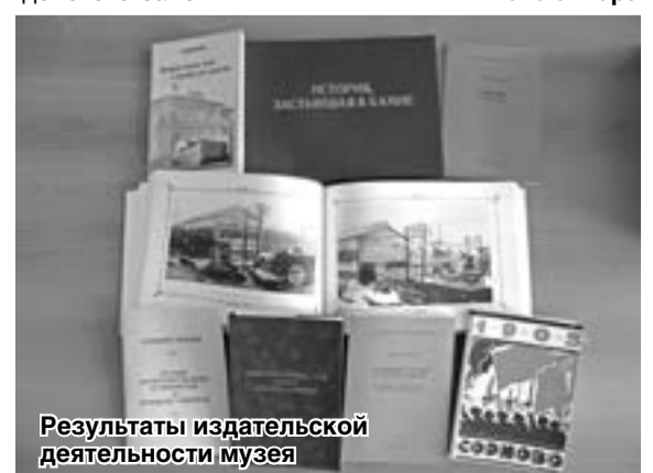
Результаты издательской деятельности музея