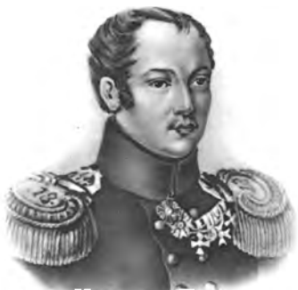
Павел Иванович Пестель