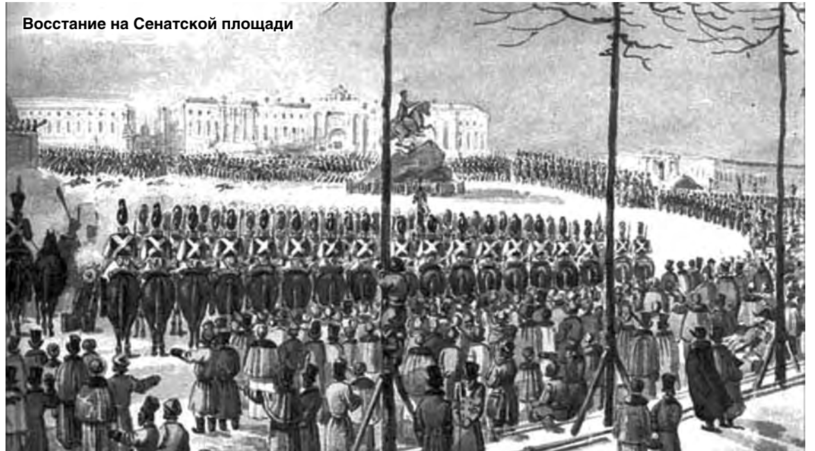
Восстание на Сенатской площади

Крюков обладал выдающимися организаторскими способностями. С началом войны с Наполеоном именно он – так как губернатор Руновский, при котором он служил, в это время лечился на кавказских минеральных водах – создал комитеты по сбору пожертвований