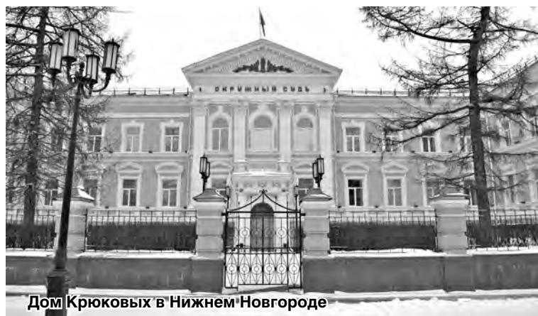
Дом Крюковых в Нижнем Новгороде