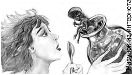
Рисунок из интернета

Симптомы. Заболевание проявляется как правило, внезапно, обычно через несколько часов после употребления заражённого продукта. Возникают головная боль, головокружение, слабость, бессонница, боль в животе, тошнота, рвота, чувство «замедления» сердца, сухость во рту, жажда. Отмечаются запоры и вздутие живота. Через некоторое время, от нескольких часов до одного-двух дней, нарушается зрение: больные жалуются на «туман», «сетку», «мушки» перед глазами, предметы видны нечётливо, нередко наблюдается их двоение. Почти всегда расширены зрачки, возможно опущение век. Одновременно или несколько позднее может присоединиться расстройство глотания (комоч в горле, боль при глотании), речь становится неразборчивой, гнусавой, развивается охриплость или полное отсутствие голоса. Может наступить расстройство дыхания – больные жалуются на нехватку воздуха, делают неожиданные паузы во время разговора, появляется чувство стеснения или сжатия в груди. Температура тела остаётся нормальной или несколько повышена. При появлении признаков