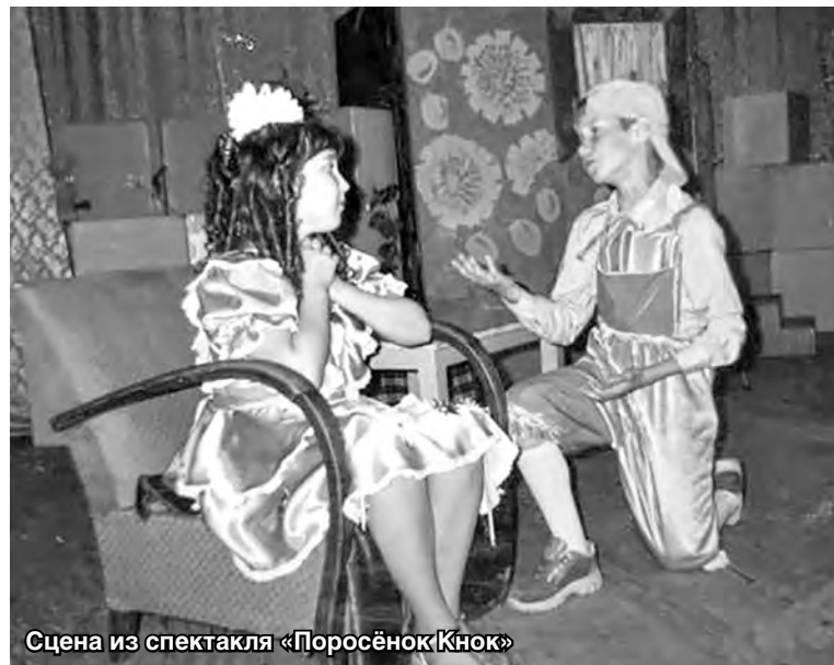
Сцена из спектакля «Поросёнок Кнок»