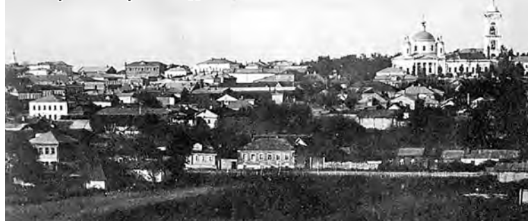
Панорама старого Подольска

Есть надежда тебе во Христе. В каждой жизни над мелочью серую Есть и будут святые места. Во Единую Троицу верую, Исповедую сердцем Христа. По плодам узнаются деревья, По делам узнаются сердца. В эти тяжкие годы кочевья Будем чисты во имя Отца. 1928