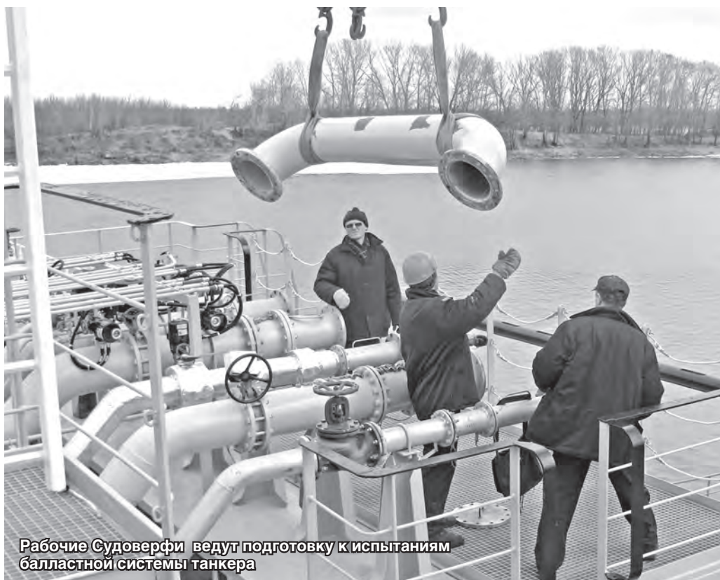
Рабочие Судверфи ведут подготовку к испытаниям балластной системы танкера