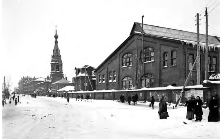
Сормово. Начало XX века

Когда благословенный час – Мечта сестры, желанье брата – В чужой стране придёт для нас Пора желанного возврата?