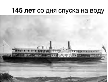
145 лет со дня спуска на воду

щихся платформ для перевозки строительных сыпучих грузов. До того советская Россия закупала эти платформы за границей. Освоение производства думпкоров Сормовским заводом в годы индустриализации сыграло важную роль в развитии промышленного транспорта и народного хозяйства страны.