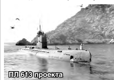
ПЛ 613 проекта