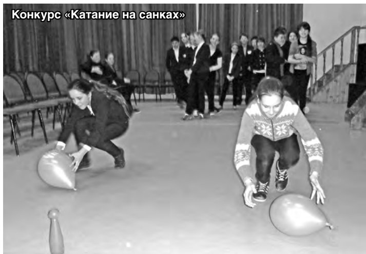
Конкурс «Катание на санках»