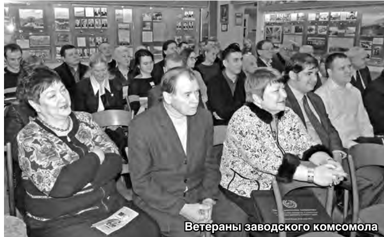
Ветераны заводского комсомола

10 февраля в музее истории завода «Красное Сормово» состоялась встреча ветеранов комсомола с молодёжным активом АО «Завод «Красное Сормово». Дата была выбрана не случайно: 10 февраля 1919 года в Сормове была создана первая комсомольская ячейка.