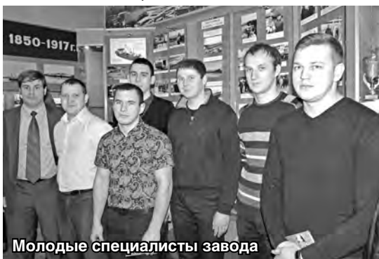
Молодые специалисты завода