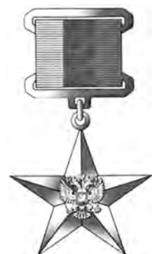
Звезда Героя Труда Российской Федерации