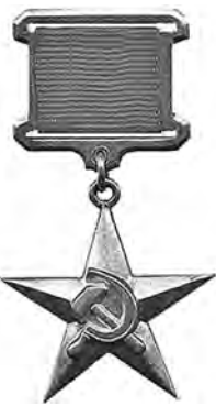
Звезда Героя Социалистического труда