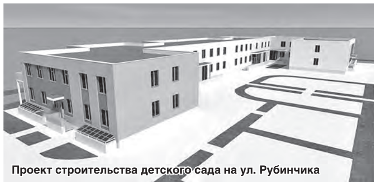
Проект строительства детского сада на ул. Рубинчика

от графика – не меньше трёх месяцев, и поставил задачу перед городскими властями три детсада сдать к 8 марта... К празднику они обязаны сделать молодым мамам такой подарок, там полтысячи детей ждут своей очереди», – подчеркнул губернатор. На днях глава региона Валерий Шанцев вместе с руководством администрации города и подрядчиками провёл инспекционный объезд строительных площадок четырёх детских садов. Это детский сад на 110 мест по улице Рубинчика в Сормовском районе, строящийся детский сад на 530 мест по улице Адмирала Макарова в Ленинском районе, реконструируемый детский сад на 100 мест по улице Лескова в Автозаводском районе и ремонтируемый детский сад №3 на 110 мест по проспекту Гагарина