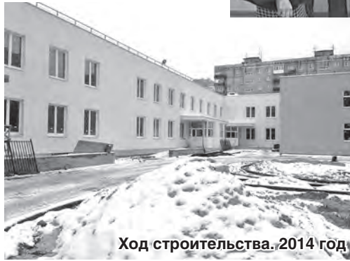
Ход строительства, 2014 год