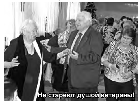
Не стареют душой ветераны!