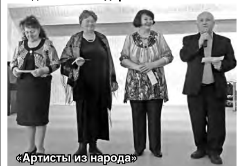
«Артисты из народа»