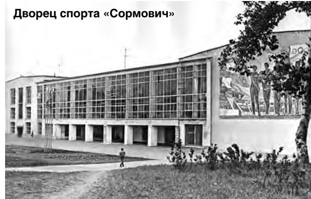
Дворец спорта «Сормович»