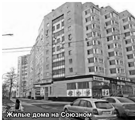
Жилые дома на Союзном

ский, на пр. Союзный; реконструкция котельных при бане №4, на ул. Пугачёва, у Сормовского рынка; – канализационный коллектор, насосная станция на пос. Народный;