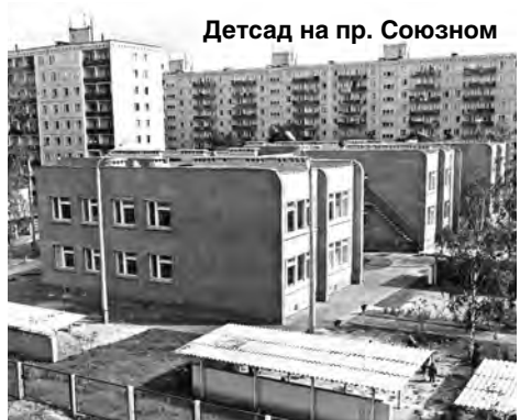
Детсад на пр. Союзном

Невозможно не вспомнить и работников цеха жилищного строительства (в котором автор этих строк проработал более 30 лет, от мастера монтажного участка до начальника цеха), внесших огромный вклад в общее дело УКСа.