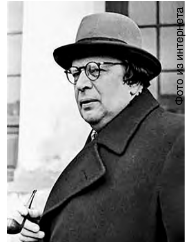
фото из интернета

30 сентября. В газете «Красный сормович» писатель опубликовал очерк, в котором развернул яркую, содержательную и красочную картину самоотверженного труда сормовичей. Статья называлась «Нас не одолеешь». На эту же тему появились его статьи в газете «Труд», в литературно-художественном сборнике, изданном главным политическим управлением Красной Армии в 1942 году. А.Н. Толстой писал: «...Сормово сильно своей