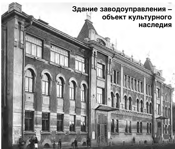
Здание заводоуправления – объект культурного наследия

В этом официальном документе специально оговаривается, что «все прочие объекты недвижимости, расположенные на данной территории не относятся к объектам культурного наследия». Это судокорпусный цех №2 (1894), механосборочный цех №6 (1906), модельный цех (1900), здание мастерских (1904), чугунолитейный цех (1895, сегодня разобран), а также здание