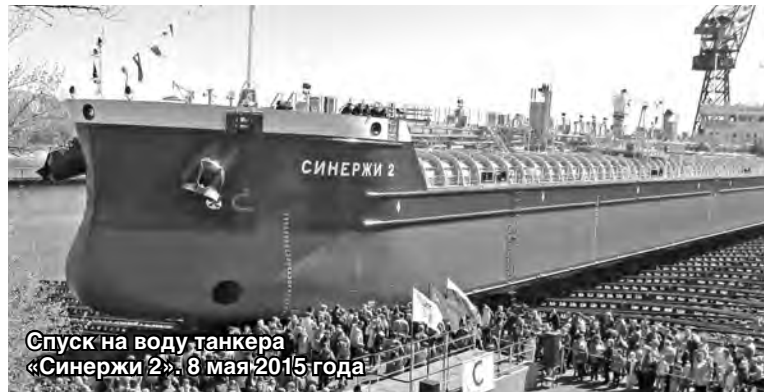
Спуск на воду танкера «Синержи 2», 8 мая 2015 года

В начале ноября Российское информационное агентство «ФедералПресс» опубликовало Рейтинг стратегически значимых предприятий, флагманов промышленности Приволжского федерального округа.