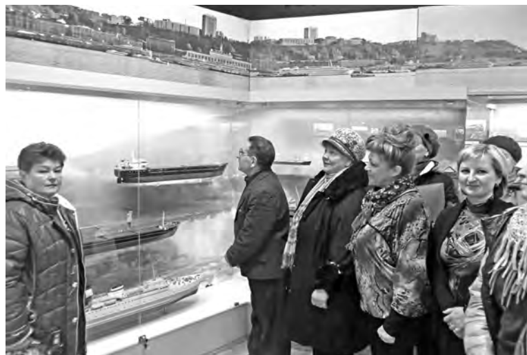
● Материалы подготовила Маргарита ФИНЮКОВА

Сотрудники музея познакомили профактивистов с обновлёнными музейными экспозициями и медиа-презентацией «Труд сормовичей во славу Отечества».