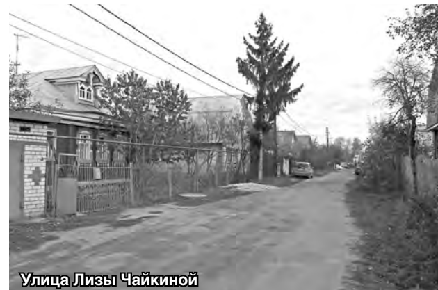
Улица Лизы Чайкиной