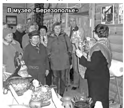
В музее «Березополье»

Сормовичи приехали в то самое Сартаково, в котором ежегодно, в конце июля, проходит литературно-музыкальный фестиваль «Хрустальный ключ», основанный по инициативе и при активном содействии поэта, писателя и мецената Владимира Исайчева, уроженца этих мест. Этот человек достоин великого уважения за то, что находит силы и средства по возрождению культуры и истории родных мест. Именно его стараниями восстановлен и затем был освящён Хрустальный родник, родник его детства, и построен в посёлке храм, носитель православной культуры и нравственности.