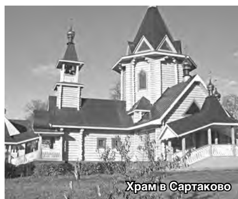
Храм в Сартаково

Именно ему принадлежат следующие замечательные строки: