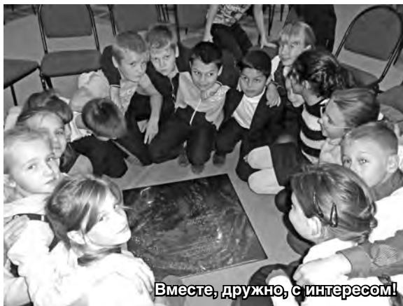
Вместе, дружно, с интересом!

На викторине маленькие «эрудиты» отгадывали птиц, улетающие от нас в тёплые края, съедобные-несъедобные грибы, и даже отвечали на хитрые вопросы, например, где зимуют раки?