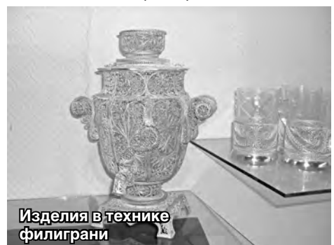
Изделия в технике филигрании

Филигрань – вид ювелирной техники, ажурный или напаянный на металлический фон узор из тонкой проволоки, гладкой или свинцовой (скань). Витую проволоку для создания ювелирных изделий в Древней Руси использовали ещё в IX-X веках. Ювелирная скань широко используется и сейчас в технике филигрании.