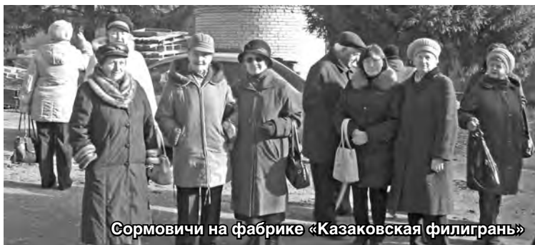
Сормовичи на фабрике «Казаковская филигрань»

Ажурной восхищаться сканью, Искусством рук её творца И всей волшебной филигранью Здесь можно, право, без конца.