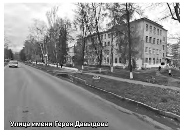
Улица имени Героя Давыдова

Похоронен в Москве на Новодевичьем кладбище.