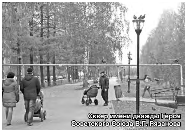
Сквер имени дважды Героя Советского Союза В.Г. Рязанова