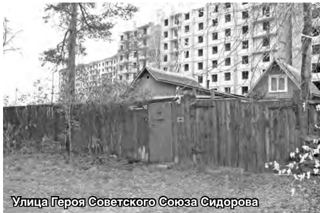
Улица Героя Советского Союза Сидорова

В ноябре 1931 года был призван на срочную службу в Красную Армию. После демобилизации в 1934 году приехал в Горький и стал работать начальником бюро пропусков