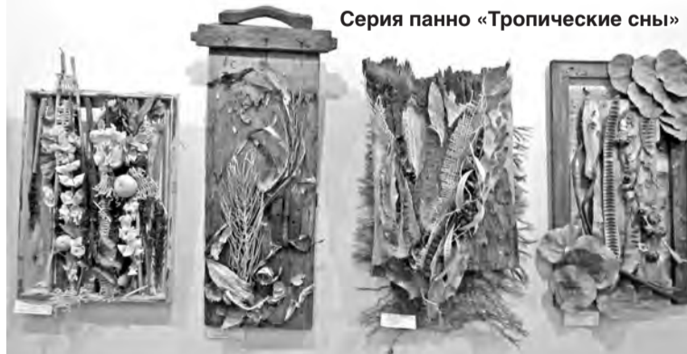
Серия панно «Тропические сны»

«Когда я работала в школе учителем начальных классов, моим любимым предметом был труд. Мой кабинет был одним из лучших, потому что всегда был эстетично, красиво оформлен».