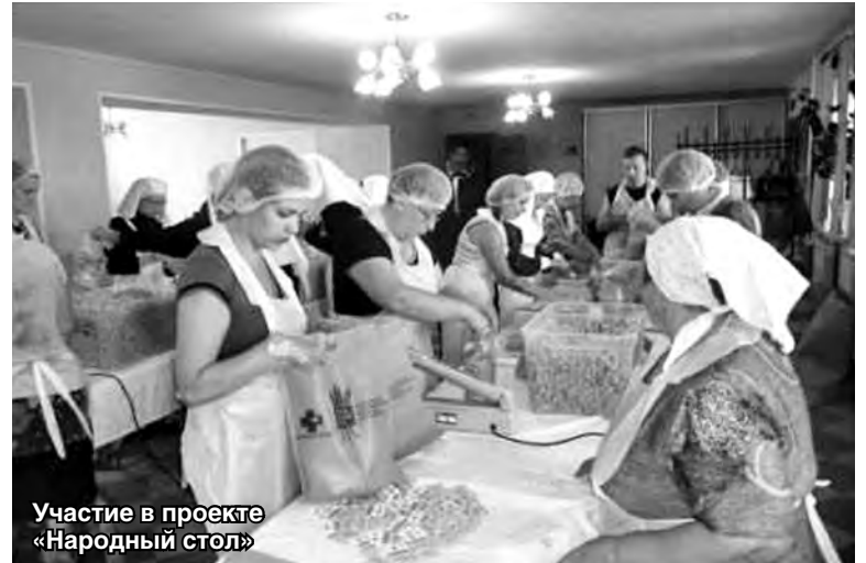
Участие в проекте «Народный стол»

Также в День защиты детей при поддержке местных предпринимателей был организован мастер-класс по арома-саше и росписи камушков. В мероприятии участвовали жители всех возрастов, получившие неподдельное эстетическое наслаждение от изготовления арт-объектов своими руками.