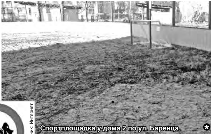
Спортплощадка у дома 2 по ул. Баренца

Знают ли о существующих Правилах владельцы животных? Возможно. Соблюдают ли их? На этот вопрос, к сожалению, существует лишь только один ответ – нет! Ярким примером полного игнорирования правил содержания и выгула собак являются, частности, жильцы домов