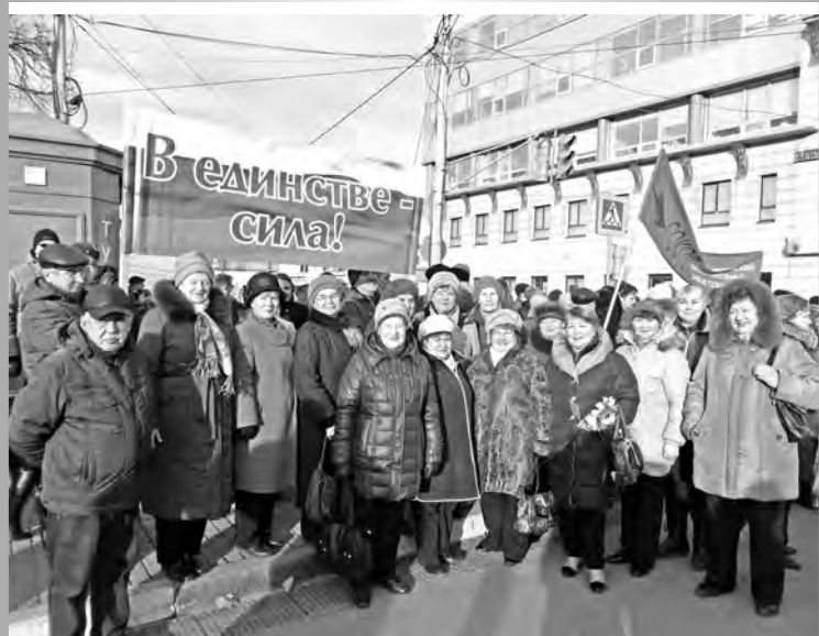
15 тысяч нижегородцев приняли участие в торжественном митинге, посвящённом Дню народного единства. В торжествах приняла участие делегация ОАО «Завод «Красное Сормово» – более 50 человек.