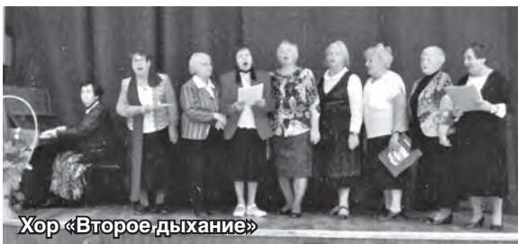
Хор «Второе дыхание»

ственной войне. Они разучивают и поют песни военных лет, а также патриотические и народные песни. Всё это ветераны делают с желанием и любовью.