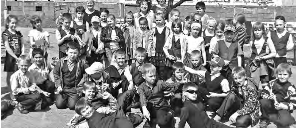
«Красная Горка», 2013 г.

Она, как и центр, называлась «Наш дом» и полностью освещала жизнь микрорайона.