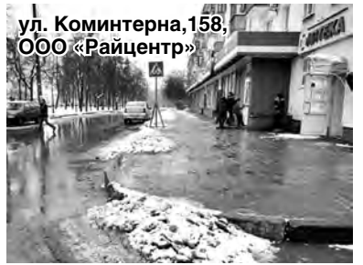
ул. Коминтерна, 158, ООО «Райцентр»

И если те, кто должен следить за чистотой во дворах, регулярно