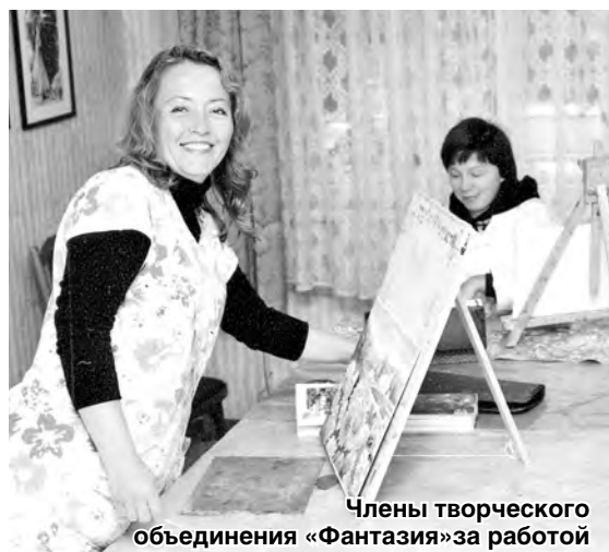
Члены творческого объединения «Фантазия» за работой