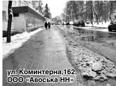
ул. Коминтерна, 162, ООО «Авоська НН»

Каждое предприятие должно почистить тротуар перед фасадом, убрать площадку вокруг здания от мусора и снега и собственным транспортом отвезти таковые на специализированный полигон. Большинство подходит ответственно к содержанию территорий