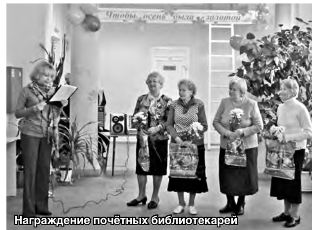
Награждение почётных библиотекарей

1 октября пенсионеры также имели возможность проверить зрение и заказать очки в выездной оптике, а от представителей ГБУ «Комплексный центр социальной обслуживания населения Сормовского района» получить информацию о пользе финской ходьбы и узнать рецепты полезного фиточая. Во время праздничной программы