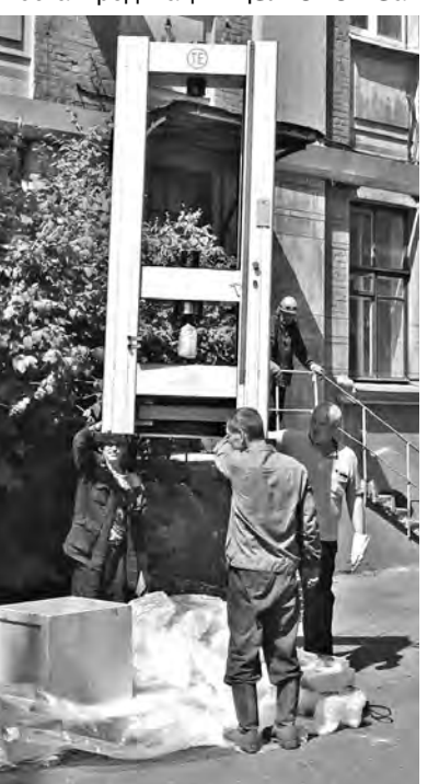
Транспортировка универсальной испытательной машины к месту эксплуатации

Большую роль в работе ЦЗЛ играет пробоподготовка. Для выдачи заключения по структуре металла в соответствии с требованиями конструкторской и технической документации перед запуском