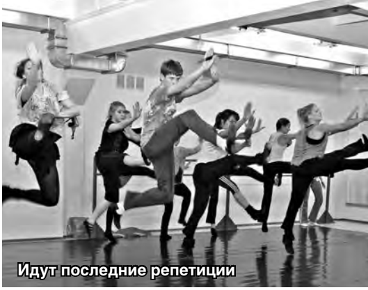
Идут последние репетиции

Судя по всему, это будет очередной бестселлер – уж очень самозабвенно и тщательно репетируют юные артисты, плюс постановщики постарались насытить действие множеством сюрпризов, ноу-хау и спецэффектов.