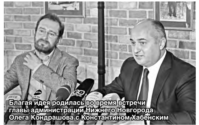
Благая идея родилась во время встречи главы администрации Нижнего Новгорода Олега Кондрашова с Константином Хабенским

Нижегородский градоначальник подчеркнул, что