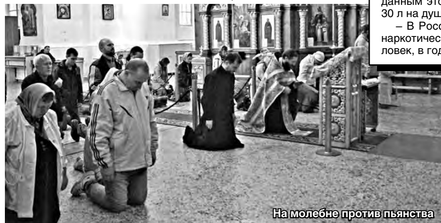
На молебне против пьянства