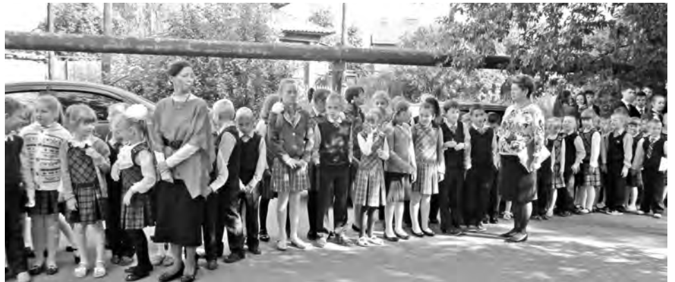
(Окончание. Начало на 1 стр.)

Инспекторы отдела пожарной надзора дают уроки безопасности в разных школах города примерно раз в месяц и обязательно — в первую декаду сентября. Также школьникам регулярно проводят экскурсии по выставке пожарной техники.