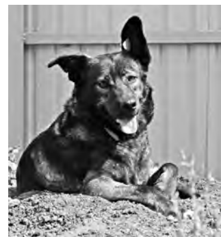
Цыганка — весёлая девчонка, возраст около года

Если Вы хотите взять её себе, звоните: 8-930-703-45-13.