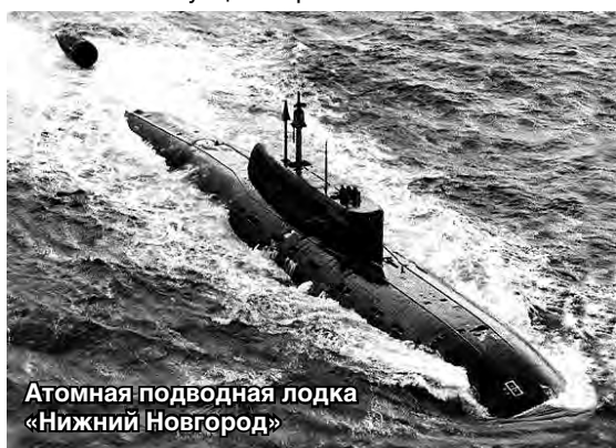
Атомная подводная лодка «Нижний Новгород»

Альберт ПОСТНОВ, член-корреспондент Академии военно-исторических наук, лауреат Государственной премии в области науки и техники