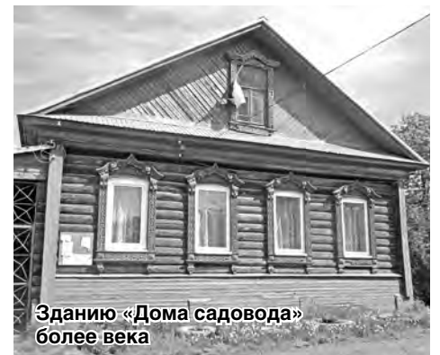
Зданию «Дома садовода» более века

Об этом здании стоит сказать особо. Этот большой бревенчатый дом в четыре окна по фасаду был построен в Сормове более 100 лет назад, а в 1954 году разобран и