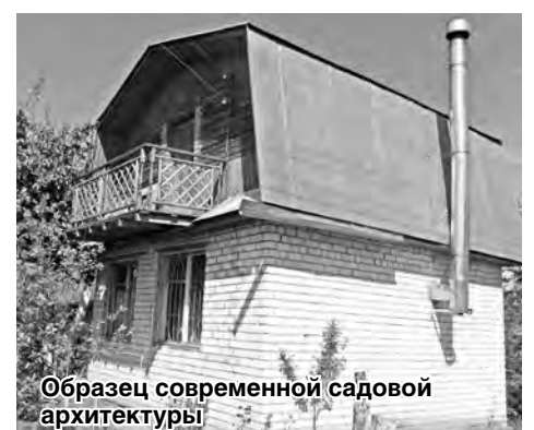
Образец современной садовой архитектуры

перенесён на территорию садоводческого товарищества №2. За 60 лет здание обветшало, но сегодня благодаря усилиям председателя помолодело и обрело вторую жизнь. Отремонтирована крыша, заменены окна, покрашены ставни. Завершена отделка актового зала на 150 мест, где теперь проходят не только собрания членов товарищества, но и концерты. Концертные номера готовят дети и внуки садоводов, в репертуаре юных актёров много песен о Сормове, о море, моряках, и, конечно, «Усталая подлодка» Александры Пахмутовой.