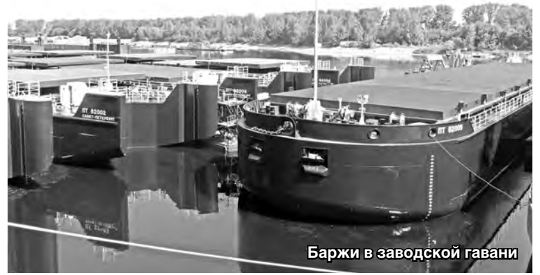
Баржи в заводской гавани