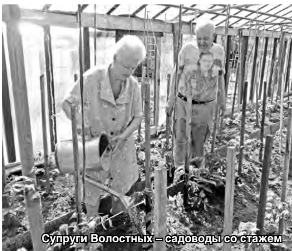
Супруги Волостных – садоводы со стажем

К 60-ЛЕТИЮ СНТ «САД №2 «КРАСНОЕ СОРМОВО»