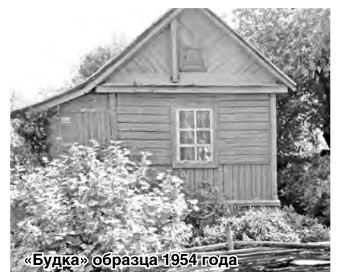
«Будка» образца 1954 года