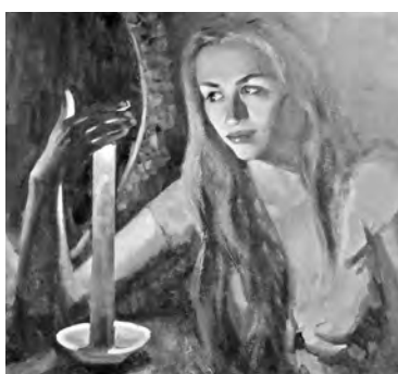
Фрагмент картины «Девушка со свечой»