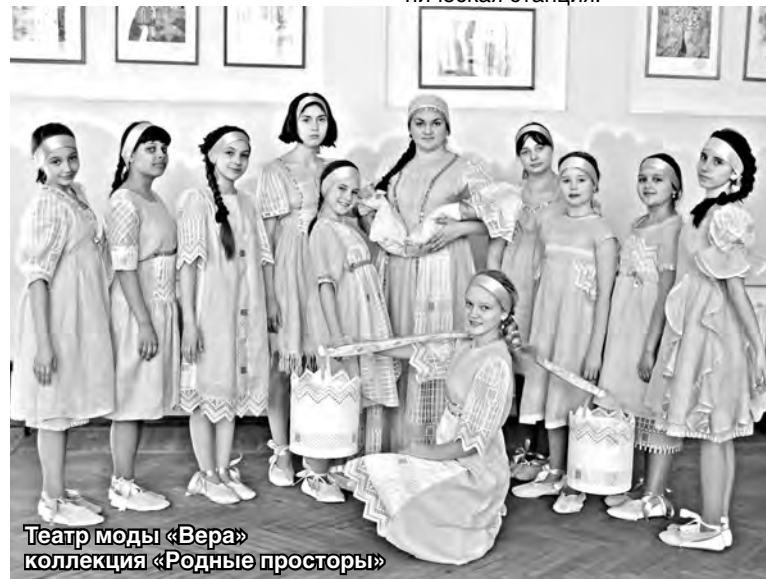
Театр моды «Вера» коллекция «Родные просторы»