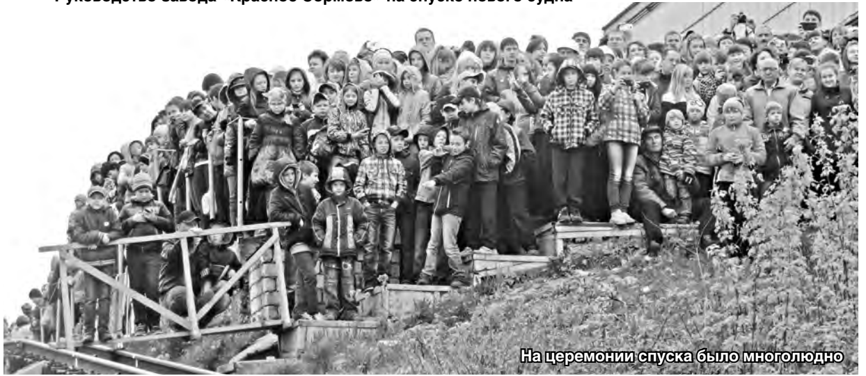
На церемонии спуска было многолюдно