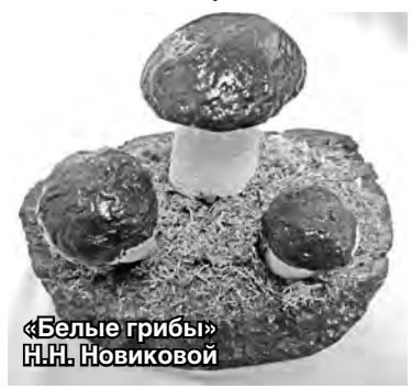
«Белые грибы» Н.Н.Новиковой

привлекли миниатюрные деревья в стиле «бонсай», выполненные из пластиковых бутылок. Н.Н. Но-