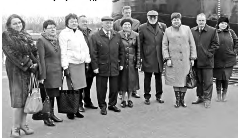
Группа директоров учреждений профобразования на фоне баржи №8, готовой к спуску на воду

собираются суда, рассказал, как традиционно проводится церемония «крещения» нового судна и пригласил на торжество по поводу спуска на воду танкера RST27, который состоится накануне Дня Победы, 8 мая.