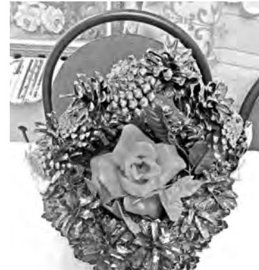
Ваза из сосновых шишек Н.Н. Новиковой

ЦЕХУ ПИТАНИЯ ОАО «ЗАВОД «КРАСНОЕ СОРМОВО» ТРЕБУЮТСЯ НА РАБОТУ: – повар – кассир Зарплата 8500 рублей. Справки по телефону: 229-62-50; 229-65-53.