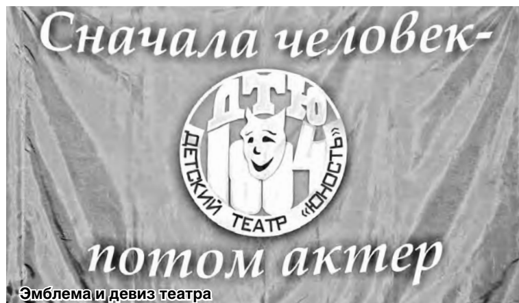
Эмблема и девиз театра