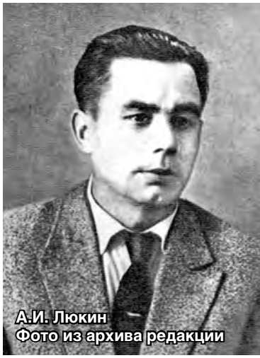
А.И. Люкин