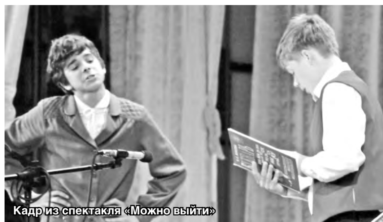
Кадр из спектакля «Можно выйти»