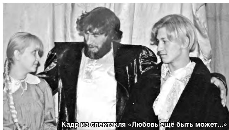
Кадр из спектакля «Любовь ещё быть может...»