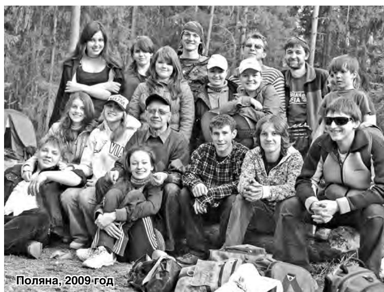
Поляна, 2009 год