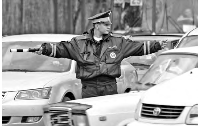
Фото из Интернета