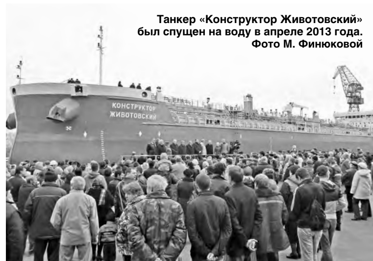
Танкер «Конструктор Животовский» был спущен на воду в апреле 2013 года.

К сожалению, из-за неполной загрузки основных производственных рабочих в Судоверфи, КСЦ, КП, их