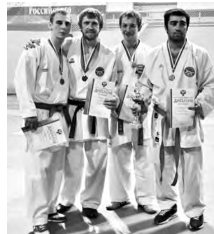
По информации пресс-службы администрации Сормовского района

Поздравляем Игоря и желаем ему дальнейших успехов и побед в спорте!