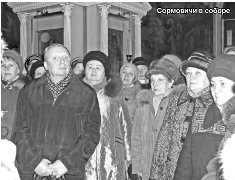
Сормовичи в соборе