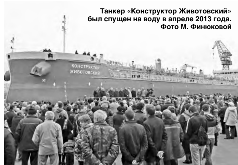
Танкер «Конструктор Животовский» был спущен на воду в апреле 2013 года.

К сожалению, из-за неполной загрузки основных производственных рабочих в Судоверфи, КСЦ, КП, их