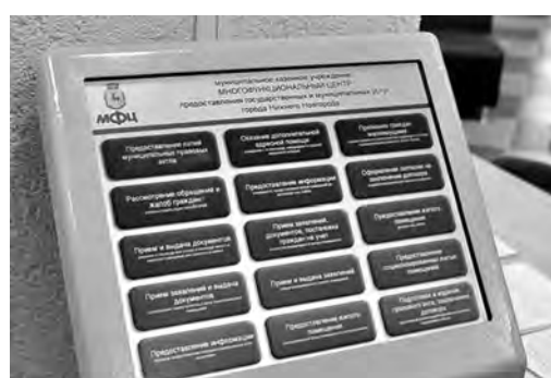
Александрович на торжественном открытии центра.

Тем временем, услугами центра в верхней части города может воспользоваться любой нижегородец.