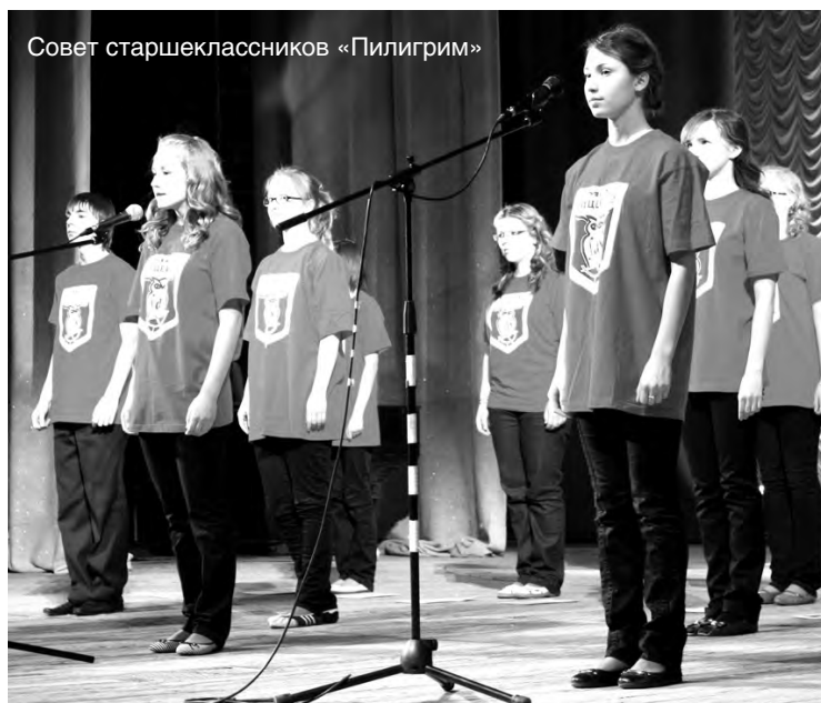
Совет старшеклассников «Пилигрим»

– Начинать я работал тогда еще в школе № 82, в старом здании на улице Баррикад. Меня, молодого специалиста без опыта, очень поддерживали другие учителя, они помогли