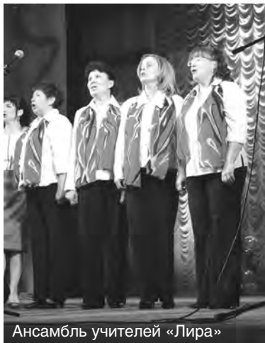
Ансамбль учителей «Лира»