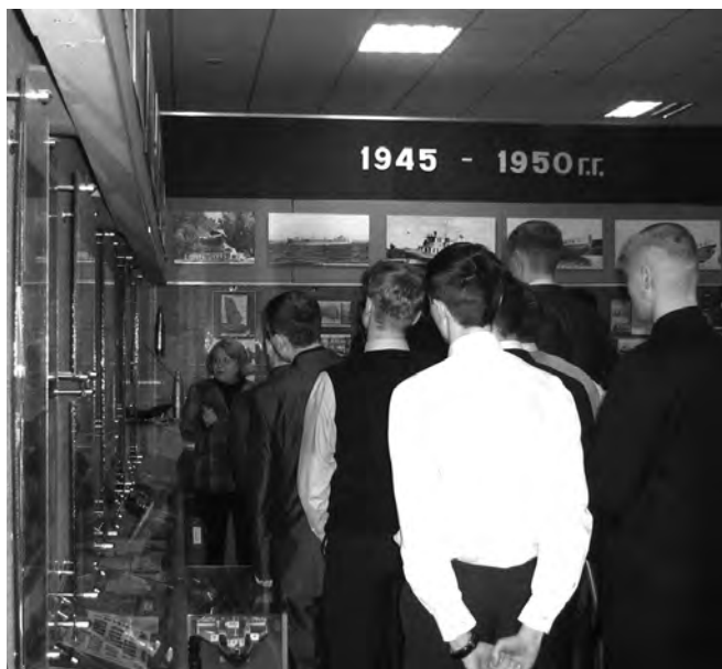
● Материалы подготовила Маргарита ФИНЮКОВА

А когда на заводе объявляется день открытых дверей по случаю спуска на воду очередного судна, многие слушатели стараются побывать на этих торжествах, чтобы лично стать свидетелями рождения нового детища сормовских судостроителей.